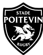
Stade Poitevin Rugby