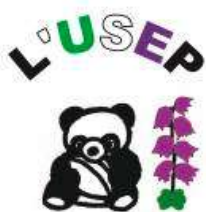
USEP Ger Seron Bedeille