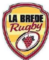
La Brede Rugby