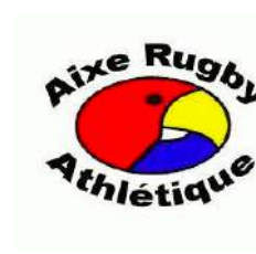
Aix Rugby Athlétique